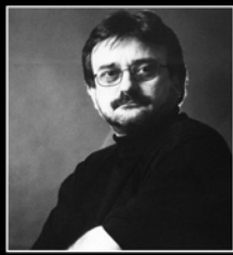
AFORIZMY STANA RADIČA

Mnohí žiaci sa v škole okrem skloňovania naučia aj skláňať.