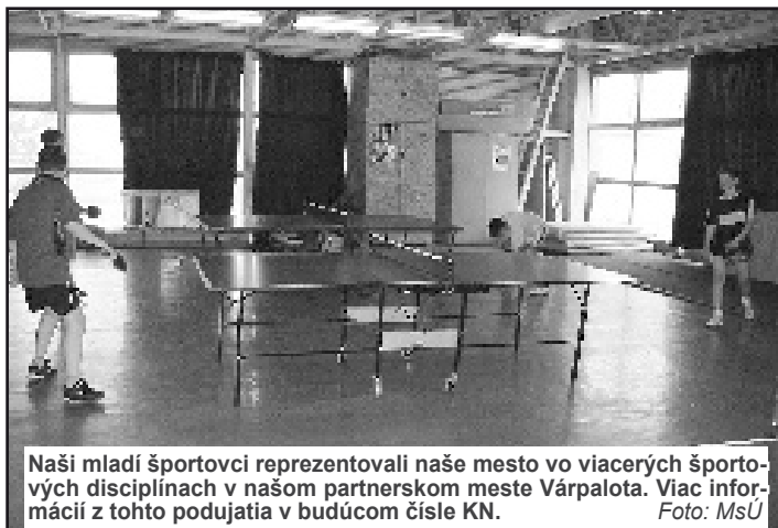
Naši mladí športovci reprezentovali naše mesto vo viacerých športových disciplinách v našom partnerskom meste Várpalota. Viac informácií z tohto podujatia v budúcom čísle KN.