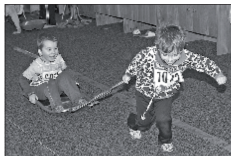
Deti v materskej škole na Langsfeldovej ulici v Kremnici vo svojej Bielej stope...