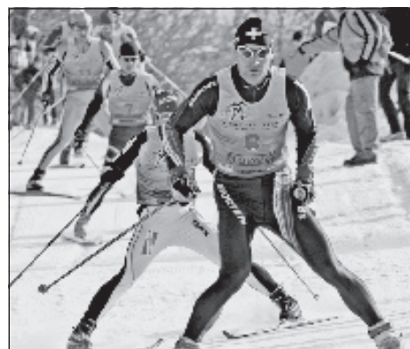
Pretekári v plnom nasadení na trati Bielej stopy.