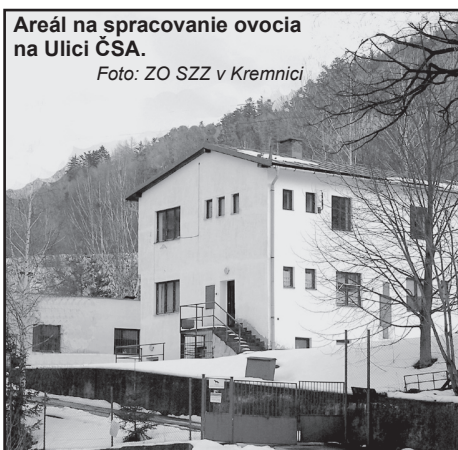
Areál na spracovanie ovocia na Ulici ČSA.