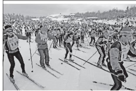
Hromadný štart na 48 km a 25 km s 741 pretekármi.