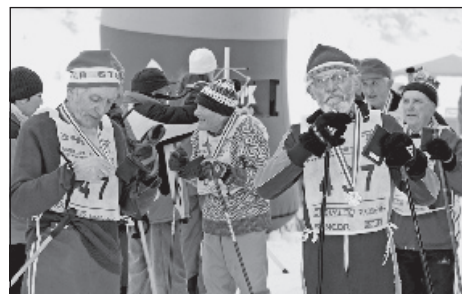
Priami účastníci Slovenského národného povstania po dobehnutí v cieľi.