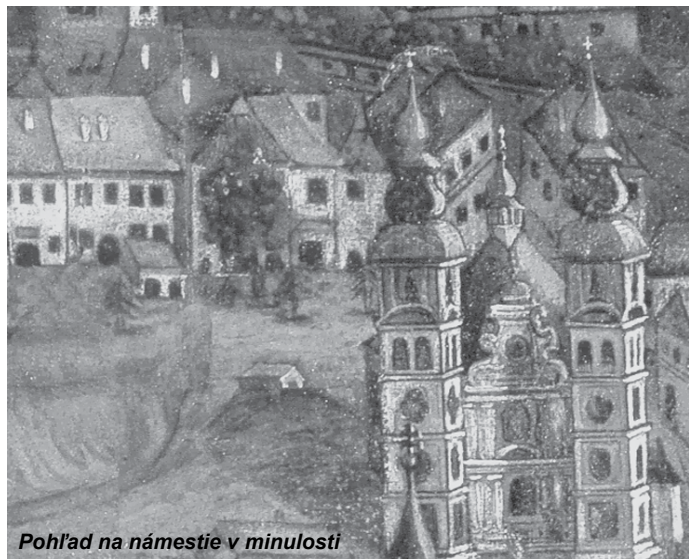
Pohľad na námestie v minulosti

Četníctvo v kremnickom okrese, ktoré číta len štyri četnícke stanice vykázalo za rok 1932 túto činnosť: Pre rôzne trestné činy bolo zatknutých 41 osôb, 12 predvedených a bolo urobené celkom 1824 trestných oznámení, Z príkazu bolo zatknutých jeden, 88 predvedených, 9 domových prehliadok 47 asistencií a eskort väzňom bolo. Mrtvol bolo nájdených päť a štyria zariadení boli nájdené.