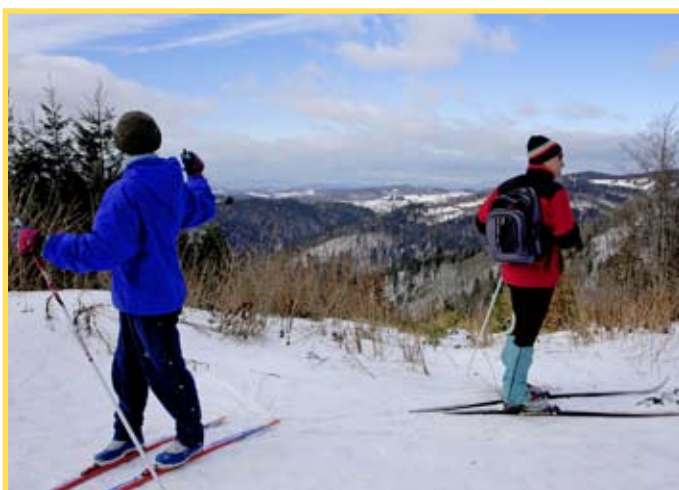
Skalka - pri slnečnom počasí sa naskytali nádherné pohľady na okolitú krajinu.