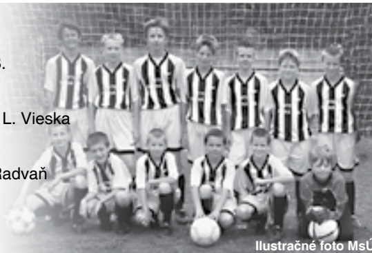
Ilustračné foto MsÚ