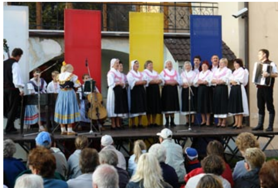
Vystúpenie ľudového súboru TURČEK v rámci Dní európskeho kultúrneho dedičstva v septembri 2007.

tovať svoje bohaté kultúrne dedičstvo Kremnica. Motto „V minciach žije pamäť“ vyjadruje, čím sa Kremnica vo svete preslávila. Sedem storočí rozvíjania kultúry bude Kremnica prezentovať od 11. do 30. septembra rôznymi výstavami, koncertmi, tvorivými dielňami, konferenciami a mnohými ďalšími podujatiami.