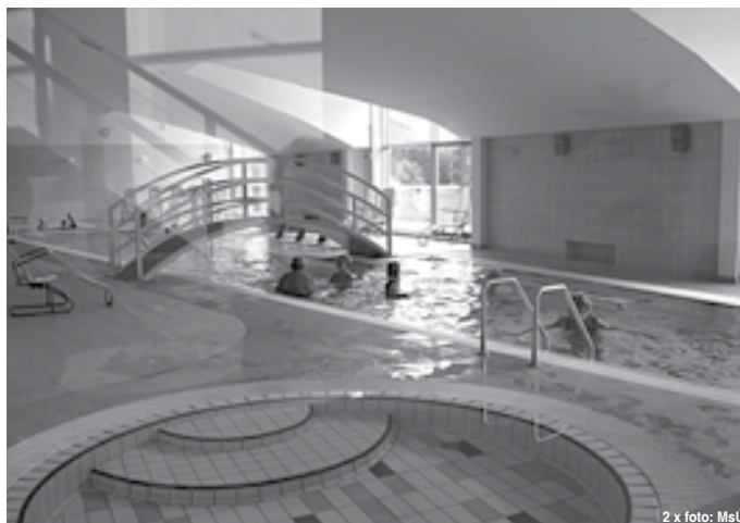
V Relax centre na Skalke je priestor na oddych aj pre nás ...