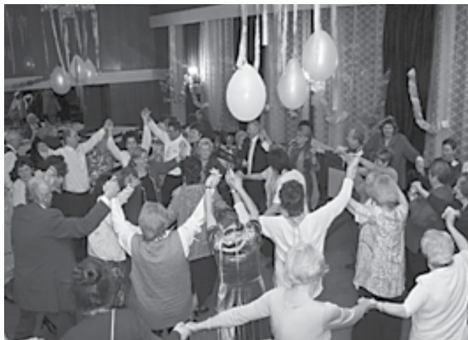
Ked' sa zabávame, tak je to od srdca a veselo...