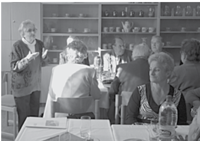
Stretnutie k výročiu klubu bolo príjemné a spomínali sme...