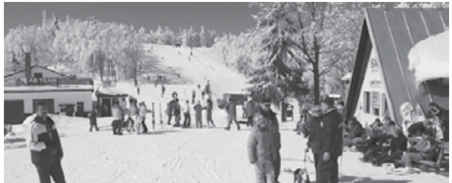
Prevažná časť pozemkov v okolí chaty ELBA bola doposiaľ voľne verejne prístupná a užívaná návštevníkmi Skalky.

MsZ uložilo mestskému úradu požiadať príslušné orgány štátnej správy lesného hospodárstva o povolenie výnimky zo zákazu činností na lesných pozemkoch za účelom úpravy lyžiarskych bežeckých tratí snežnými mechanizmami.