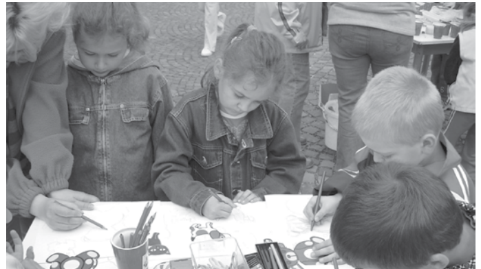
Do festivalu sa každoročne aktívne zapájajú aj škôlkári.