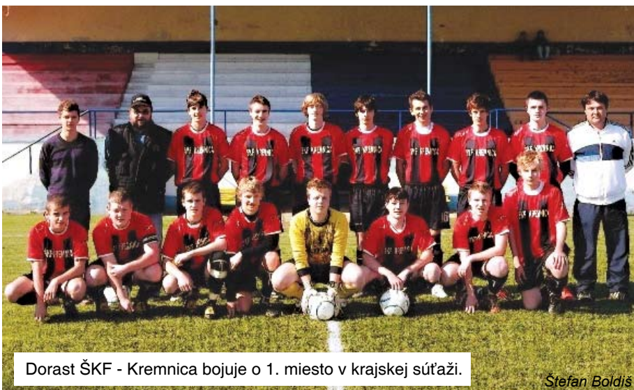
Dorast ŠKF - Kremnica bojuje o 1. miesto v krajskej súťaži.