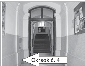
Okrsk č. 4

Štefánikovo námestie, Námestie SNP, Angyalova ulica, Bystrická ulica, Partizánska dolina, Ul. P. Križku, Ul. J. Kollára, Mesto Kremnica (bez určenia ulice a čísla domu)