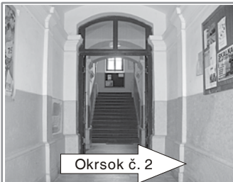
Okrsk č. 2

Zámocké námestie, Zlatá ulica, Továrenská ulica, Ul. J. Langsfelda, Štúrova ulica, Ul. Rumunskej armády, Kutnohorská ulica, Banská cesta, Nová dolina, Ul. J. Horvátha (čísla domov 860, 861, 862, 863, 871, 872, 878, 887, 888, 892, 893, 894, 896, 897, 898, 899, 900, 901, 912, 913, 916, 917, 918, 919, 920 a 922), Revolta