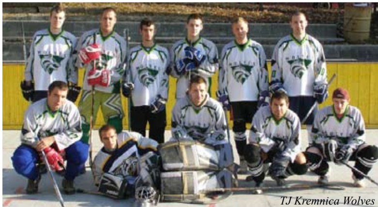
TJ Kremnica Wolves

Hokeybalový oddiel TJ Kremnica Wolves účinkuje od 5. 9. 2010 vo svojej druhej sezóne v 2. banskobystrickej hokeybalovej lige. Po 10 kolách sa náš tím nachádza v tabuľke na 4. mieste zo 16 tímov ligy.