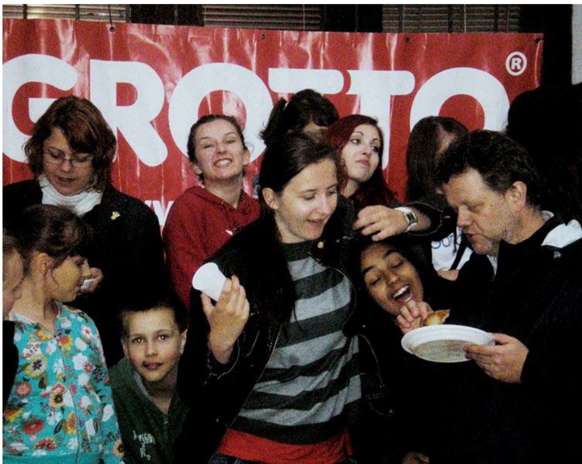
Foto zo súťaže Prednášam, teda som ... z mája 2011. Ďakujeme všetkým, ktorí nám pri organizácii tejto súťaže pomohli: Múzeu mincí a medailí, firme Grotto a.s., jedálni pri ZŠ Angyalova, CVC Cvrček, internátu pri ZŠ pre sluchovo postihnutých Viliama Gaňu a mestu Kremnica.