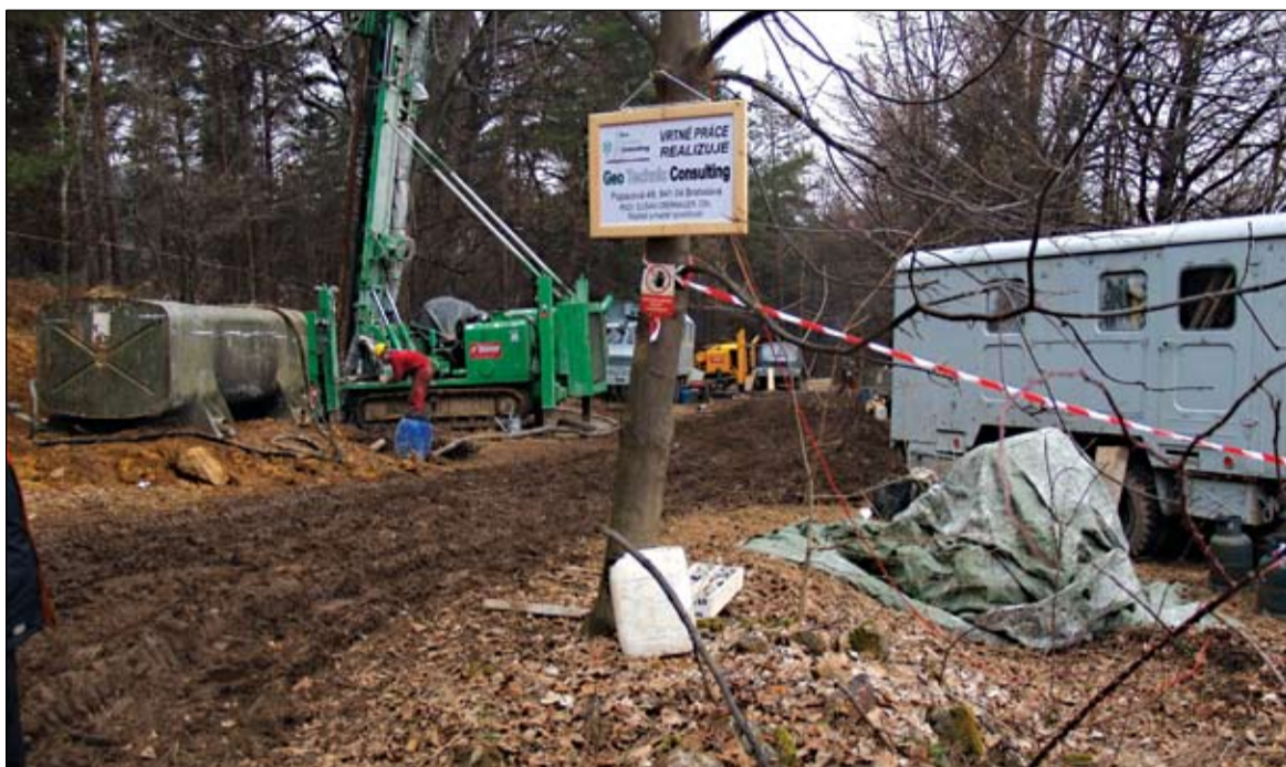
Záber z terénu, v ktorom pred rokmi prebiehal geologický prieskum.

Dňa 17. 10. 2011 Obvodný úrad životného prostredia v Banskej Štiavnici poslal mestu Kremnica oznámenie, že mu bol doručený