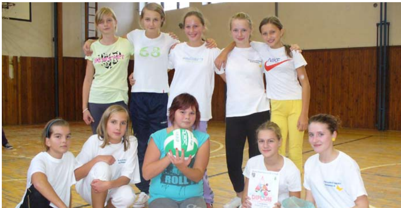
Vítazky vybíjanej zo Základnej školy na Ulici P. Križku

V mesiacoch október a november organizuje CVČ Cvrček v Kremnici tradičné Dni športu. Výsledky turnajov vo futbale a florbale sú zároveň výsledkami 1. kola regionálnych líg, ktoré budú pokračovať v mesačných intervaloch do mája 2012. Žiaci základných a stredných škôl si zmerali svoje sily vo futbale, florbale, volejbale, basketbale a vybíjaní.