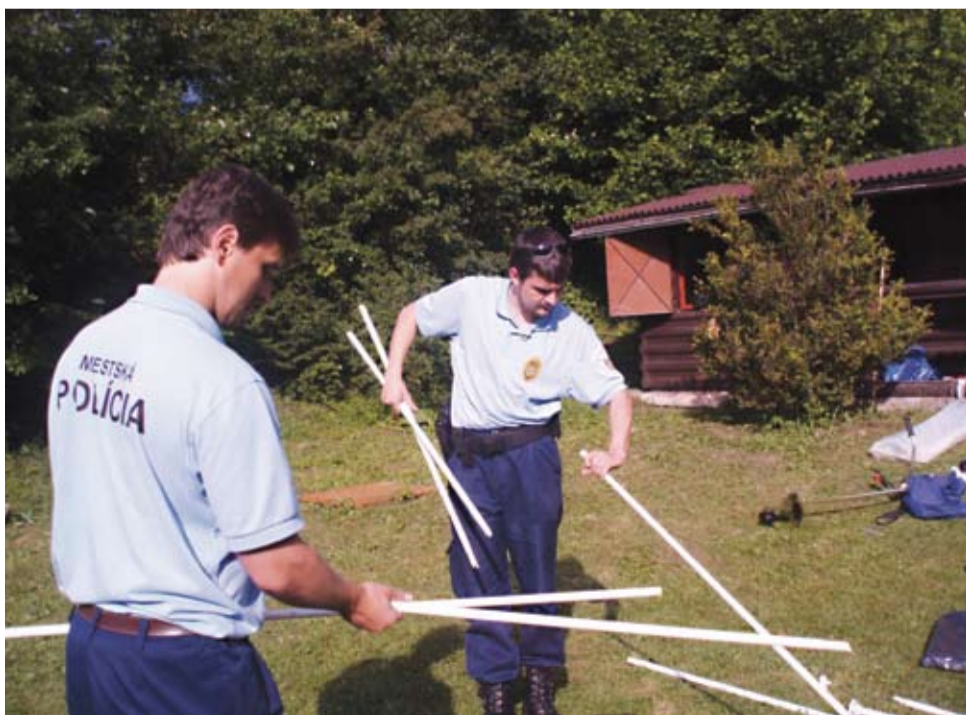
Príslušníci Mestskej polície pri prípravách hier a súťaží pre deti.