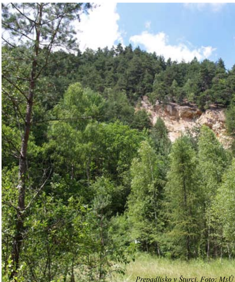
Prepadlisko v Šturci.

OZ Kremnica nad zlato (www.kremnicanadzlatu.sk)