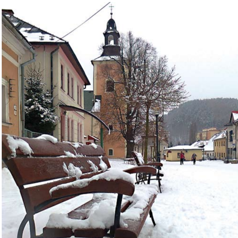
Biela zima v uliciach mesta.