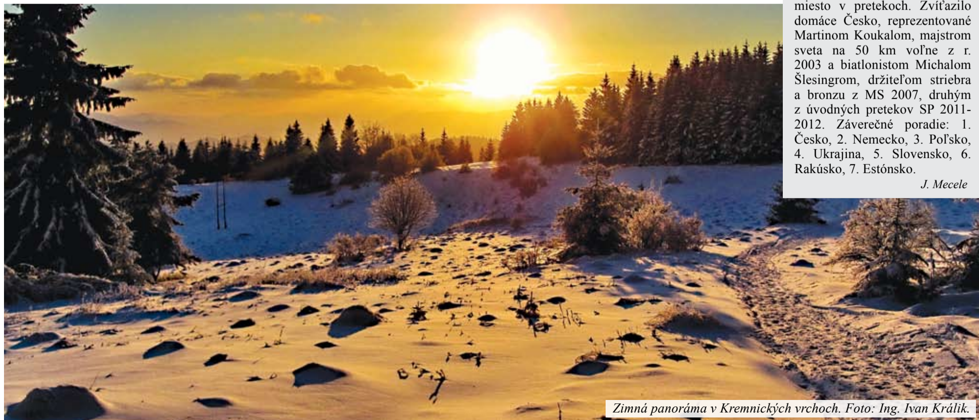
Zimná panoráma v Kremnických vrchoch.