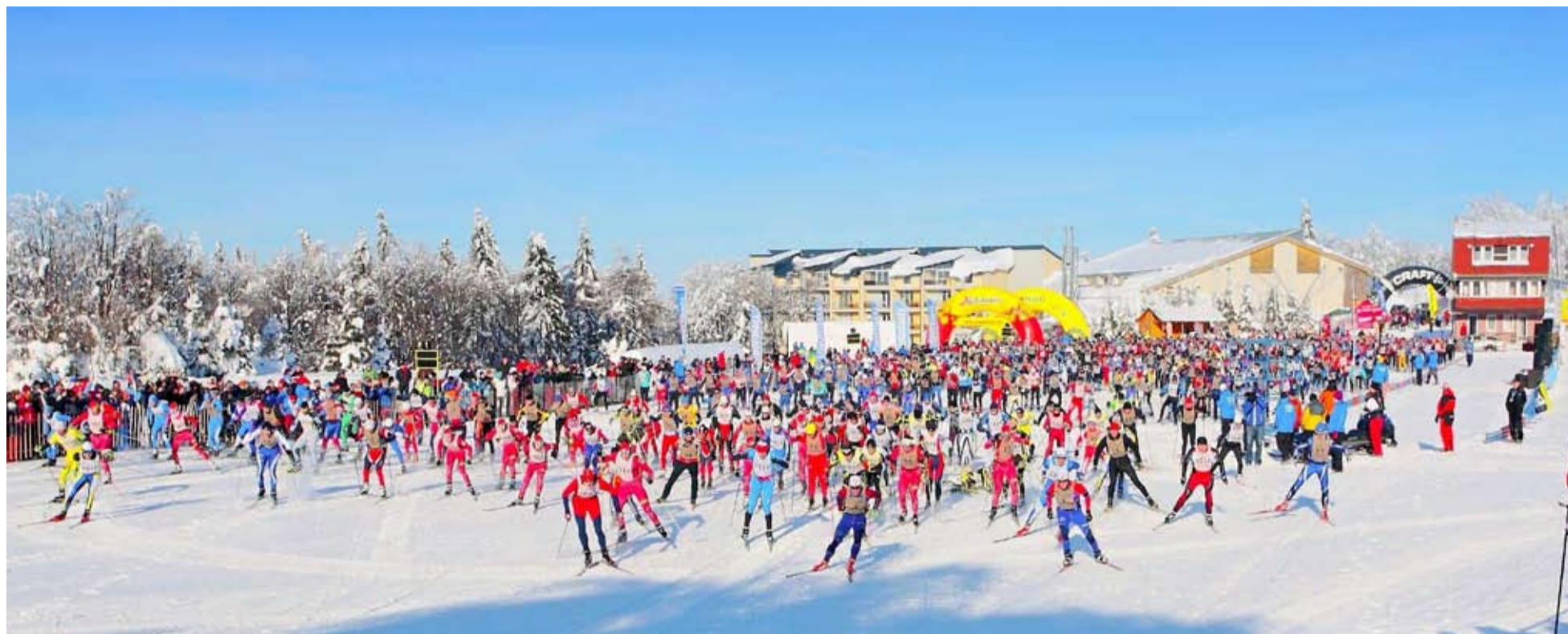
Hromadný štart na štadióne R. Čillíka na Skalke.