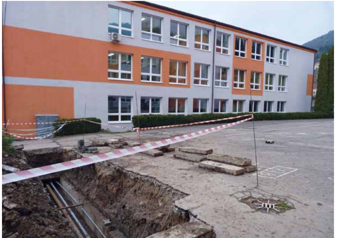
Rozkopávka nepoškodila prístupovú cestu ani chodník pri budove školy.

Inú dlhodobú závalu škola odstránila v lete. Regionálny úrad verejného zdravotníctva upozorňoval jedáleň základnej školy na nutnosť výmeny vzduchotechniky od roku 2006. Kvôli nedostatočnému odsávaniu pár v kuchyni bolo totiž nutné kuchyňu každý rok vymalovať a škola musela na zabezpečenie hygieny používať veľké množstvo chemických čistiacich prostriedkov. Sumu 10 000 € potrebnú na výmenu vzduchotechniky poslanci schválili vo februári tohto