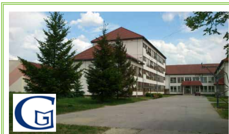
Spojená škola Gymnázium Mikuláša Galandu

Horné Rakovce 1440/29, 039 01 Turčianske Teplice