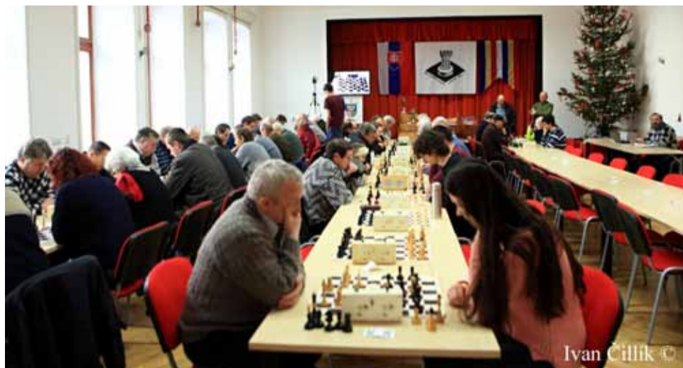
Ivan Čillík ©

A poslednýkrát nám naši hráči urobili radosť 29. 11., kedy sme doma privítali Banskú Štiavnicu: MsL Kremnica : Opevnenie Banská Štiavnica „B“ 7:1 Posledný zápas nás čaká